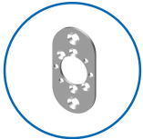
Plattenform oval 22x42 vertikal

Die Produkte können von den dargestellten Bildern abweichen