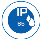
Schutzart IP65 (Ø40mm)