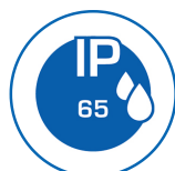
Schutzart IP65 (Ø40mm)