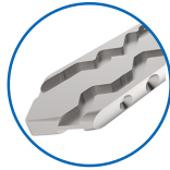
Couleurs maillechort brillant