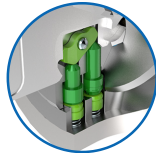
Active Safety mit