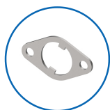
Plattenform oval 25x43 horizontal