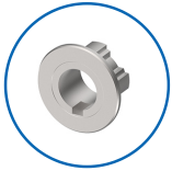
Rosettenausführung Ferma/Steloc Kombi

Die Produkte können von den dargestellten Bildern abweichen