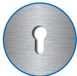
Zylinderausschnitt ausen, innen PZ