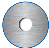
Zylinderausschnitt ausen, innen RZ