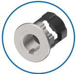
Rosettenausführung Terza/Geco Kombi

ⓘ Die Produkte können von den dargestellten Bildern abweichen