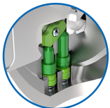
Active Safety mit

Die Produkte können von den dargestellten Bildern abweichen