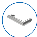
Type de poignées U11