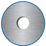
Zylinderausschnitt ausen, innen RZ

Die Produkte können von den dargestellten Bildern abweichen