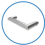
Type de poignées U11