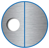
Zylinderausschnitt ausen RZ, innen blind

Die Produkte können von den dargestellten Bildern abweichen