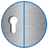
Zylinderausschnitt ausen PZ, innen blind

Die Produkte können von den dargestellten Bildern abweichen