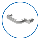
Drückerform U22 abgesetzt