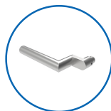
Drückerform L11 abgesetzt