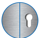
Découpe de cylindre extérieur aveugle, intérieur 17mm

Les produits peuvent différer des images présentées