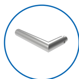
Type de poignées L11