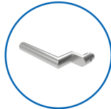
Drückerform L11 abgesetzt