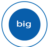
Profil de performance BIG

Les produits peuvent différer des images présentées