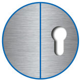
Zylinderausschnitt ausen blind, innen PZ

Die Produkte können von den dargestellten Bildern abweichen