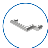
Type de poignées U11 coudée