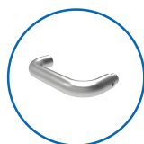
Type de poignées U22