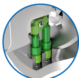
Active Safety mit

Die Produkte können von den dargestellten Bildern abweichen