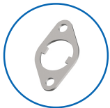
Plattenform oval 25x43 vertikal