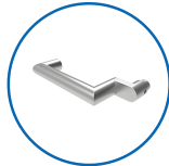
Drückerform U11 abgesetzt